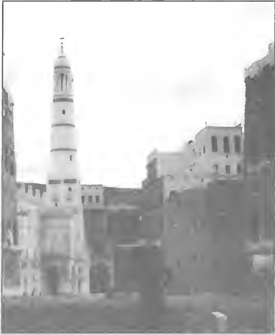
مئذنة مسجد الرياض وبه الرباط الذي أسسه الحبيب علي الحبشي والذي تخرج منه كثير من العلماء ونشروا الدعوة في كثير من أصقاع العالم